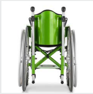
Abnehmbare, anatomische Rückenschale aus Aluminium