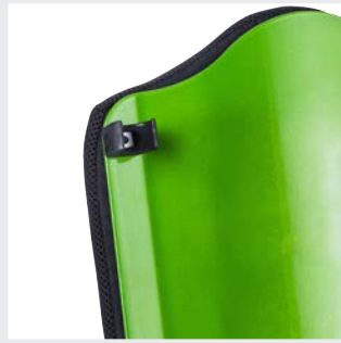
Werkzeuglos am Rückenrohr montierbar