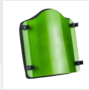
In Rahmenfarbe mit Flash Logo